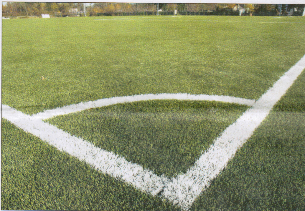
Najwyższej jakości murawa otrzymała dwugwiazdkowy certyfikat od Międzynarodowej Federacji Piłkarskiej FIFA

Boisko o długości 105 metrów i szerokości 68 metrów spełnia wymogi Międzynarodowej Federacji